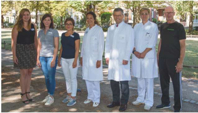
Sehr geehrte Damen und Herren,

denken, kommunizieren und mobil zu sein, macht das Leben aus. Dies gilt auch und gerade für Menschen, die durch die Implantation einer Endoprothese ihre Mobilität zurückgewonnen haben. Aber es gehört Zutrauen und manchmal Mut dazu, wieder körperlich aktiv zu werden.